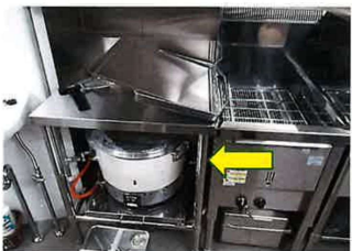
15 炊飯台車付ワークテーブル ホシザキ電機 W650×D600×H800