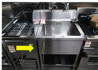
20 一槽シンク ホシザキ電機 W600×D600×H800