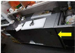
8 キャビネットテーブル ホシザキ電機 W1390×D610×H800